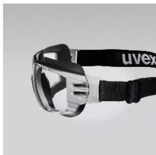
x-tended eyeshield couverture parfaite