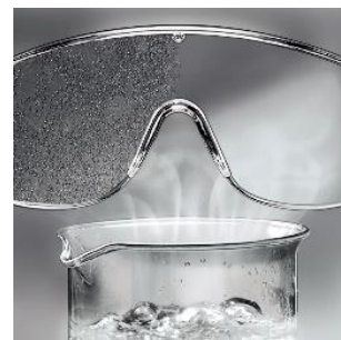
uvex supravision extreme