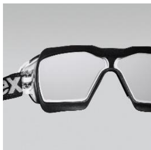
Large champ de vision