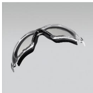
Forme optimale et légèreté