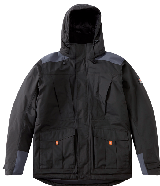
■ 1494 DARK BLACK