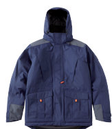
■ 1482 NAVY